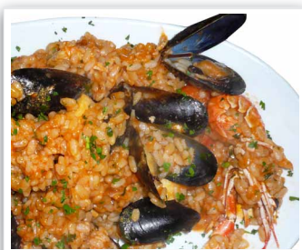
Risotto alla pescatora