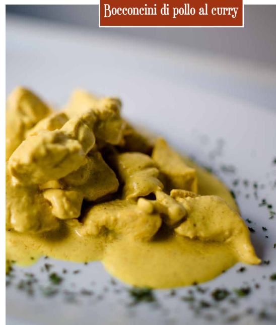
Bocconcini di pollo al curry