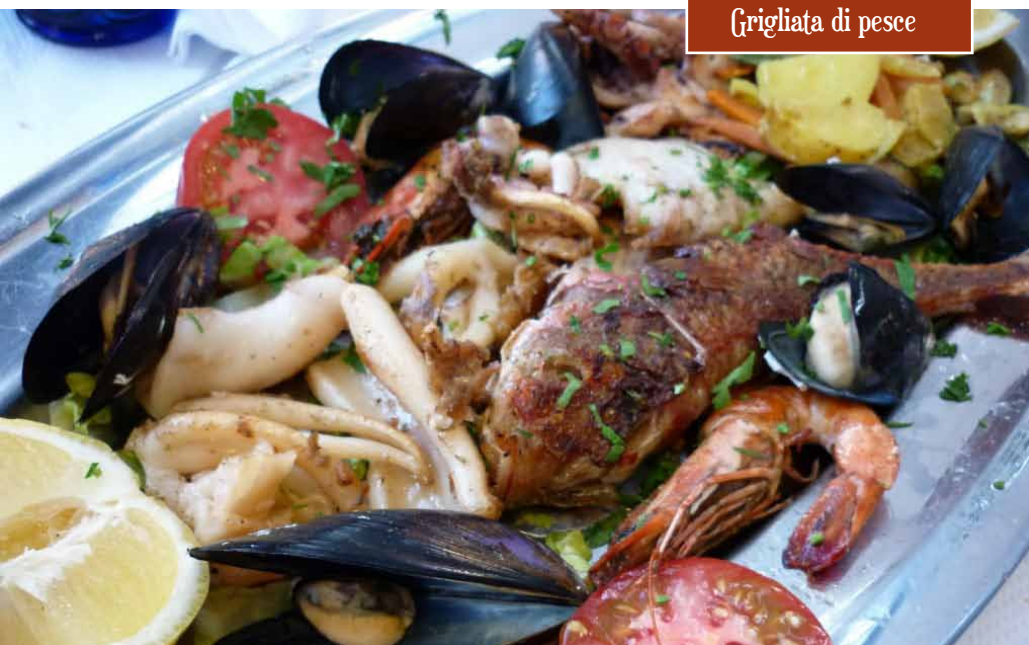
Grigliata di pesce